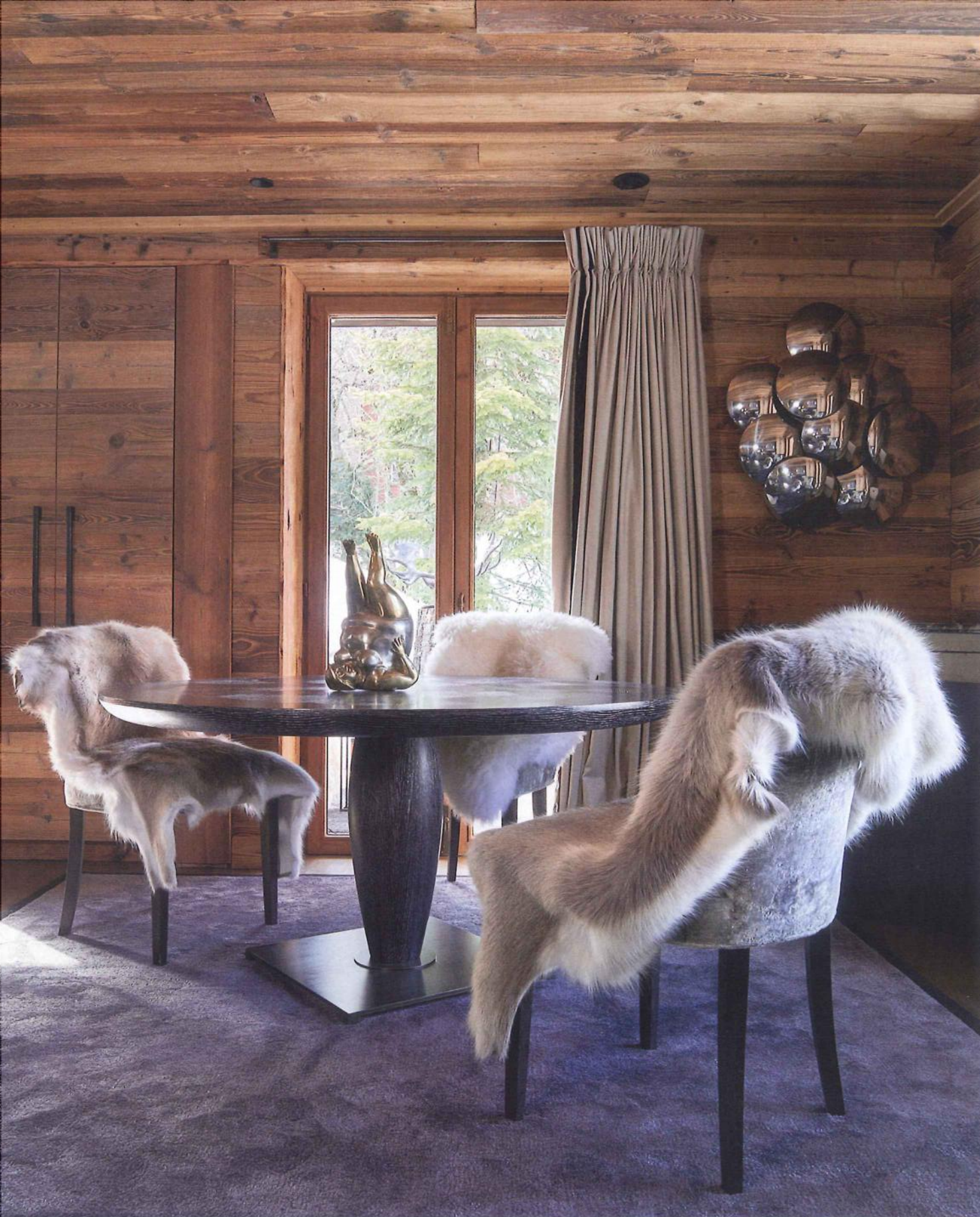
À GAUCHE. Un coin salle à manger feutré. Table en chêne brossé à la feuille d'argent, pied en bronze, design Romeo Sozzi, Promemoria. Chaises recouvertes de velours, Nobilis. Fourrures, Les Greniers d'ici et d'ailleurs. Sculpture, Poil de Carotte à Megève. Applique vintage chinée à Milan. Tapis sur mesure, Europe Moquette. À DROITE. Tout en vieux bois récupéré, la cuisine, réalisée sur mesure par Perrin et fils, est très fonctionnelle. Stores rouges, Deletraz Décoration. Suspension "Messalina So", Contardi Lighting. Service à thé et faitout Alessi, cocotte Le Creuset, Touzeau à Annemasse.